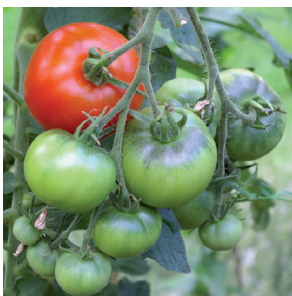
Tomat Solanum lycopersicum , Potentat II NGB13643, FS0023

En stor del af vores aktiviteter går ud på at samle frø og dele dem med andre medlemmer. På den måde er Frøsamlerne med til at bevare havekulturen og vi får en mangfoldighed af sorter at dyrke i vores haver og nyde på vores middagsborde.